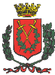
Comune di Caldiero