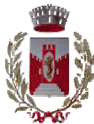
Comune di Illasi