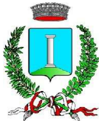
Comune di Colognola ai Colli