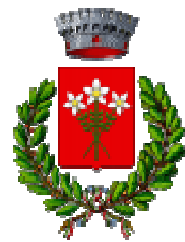
Comune di Belfiore