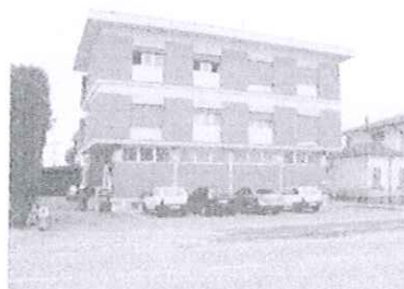
Centro Socio Sanitario Distrettuale di Taglio di Po