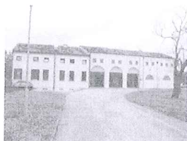
Centro Socio Sanitario Distrettuale di Porto Viro

Centro Socio Sanitario Distrettuale di Porto Tolle