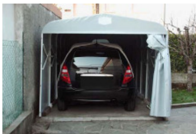
Box auto a pantografo