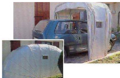
Box auto a chiocciola

Per questo tipo di opere non serve nessuna autorizzazione in quanto attività edilizia libera.